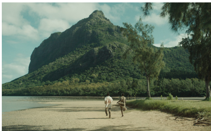
Extrait du film : la fuite vers le Morne