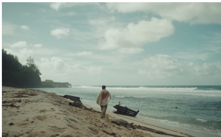
Extrait du film