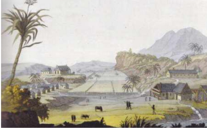
Gravure d'après l'Encyclopédie, 1751-1772, colorisée au XIX e siècle.