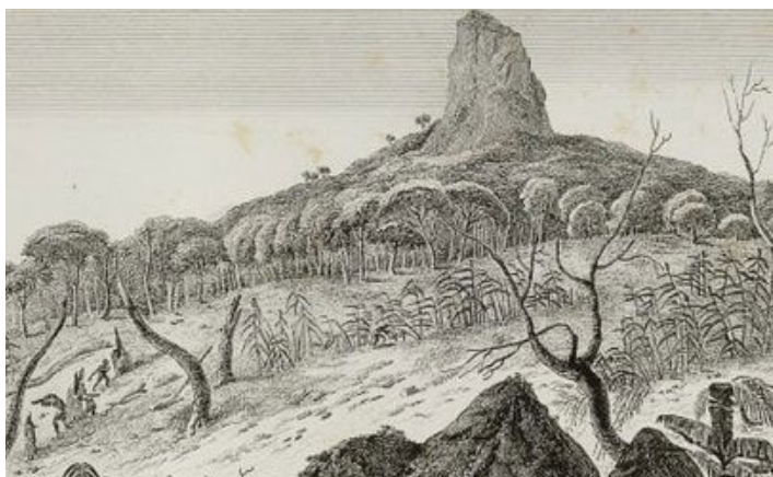
Ile-de-France. « Vue de la Montagne du Pouce et d'un défriché. » Le Brun, dessinateur ; Jacques Gérard Milbert, graveur. 1812. Estampe. In : Voyage pittoresque à l'île-de-France, au Cap de Bonne-Espérance et à l'île de Ténériffe , planche 12. Coll. Musée de Villèle.