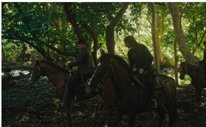
Extrait du film : Les soldats Français Madame La Victoire et ses fils, chasseurs d'esclavisés