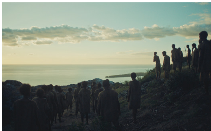
Extrait du film