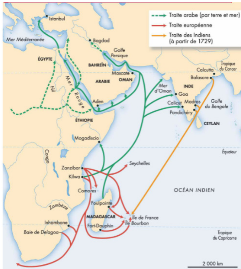
Carte de la traite dans l'océan Indien, extrait de l'Atlas des esclavages, Marcel Dorigny et Bernard Gainot, ed. Autrement, 2013.

Ce commerce diversifié entraîne un métissage culturel, où des influences africaines, indiennes, malgaches et européennes se retrouvent dans les langues, les cuisines, les musiques et les religions des îles de la région. Cette interconnexion et cette diversité culturelle forment l'une des spécificités notables de la traite négrière dans l'océan Indien.