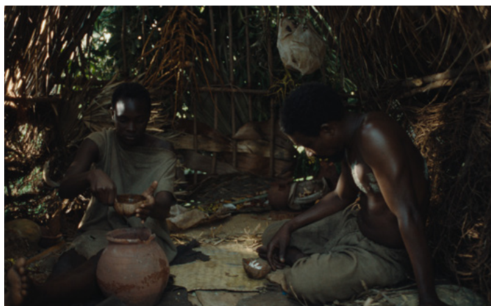
DOC 1B. EXTRAIT DU FILM

« La caverne ». Tony de B, Les Marrons , L.-T. Houat, Paris, Ebrard, 1844. Bibliothèque administrative et historique des Archives départementales de La Réunion