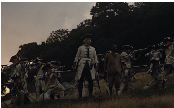
Extrait du film : Les soldats Français