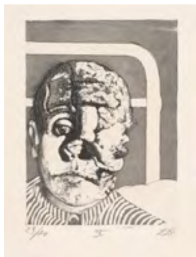
Document 2 : Otto Dix, Transplantation , 1924 Eau forte, Aquarelle et pointe sèche dans la série La Guerre , livre II, 19,5X21 cm

Plusieurs sources, ici : MOMA, New York, Etats-Unis