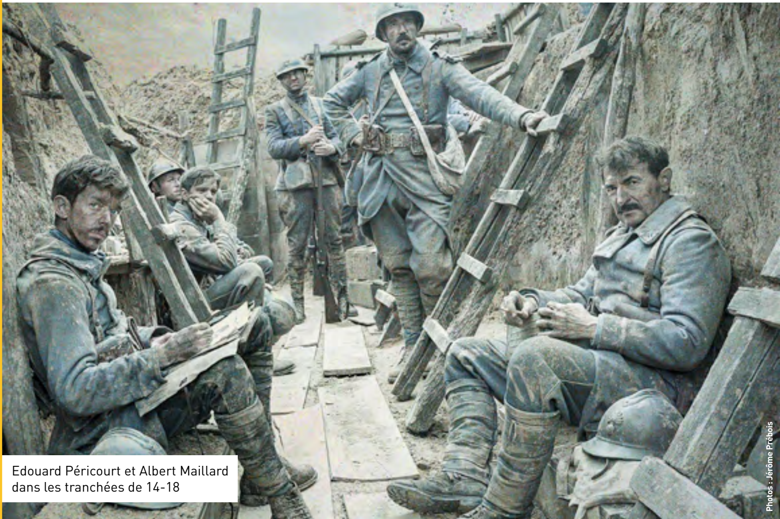
Edouard Péricourt et Albert Maillard dans les tranchées de 14-18