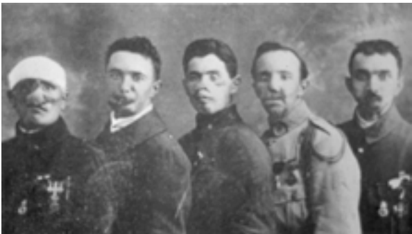
Document 4 : La Délégation des gueules cassées, témoin de la signature du Traité de Versailles, le 28 juin 1919