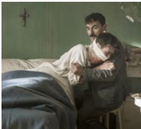
Document 1 : Douleur