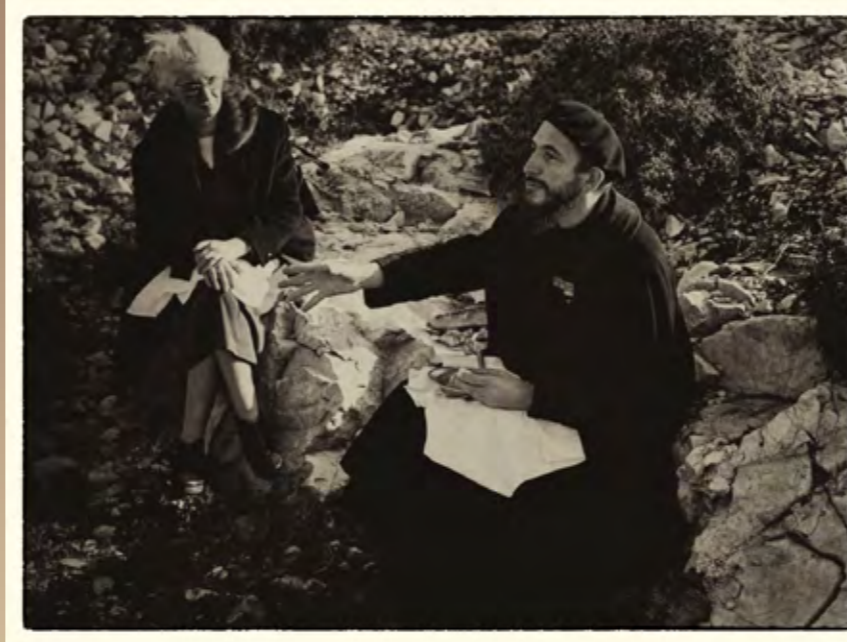
L'abbé Pierre et Lucie Coutaz

L'abbé Pierre lance un appel à l'aide sur la radio nationale (RTF) et sur Radio Luxembourg.