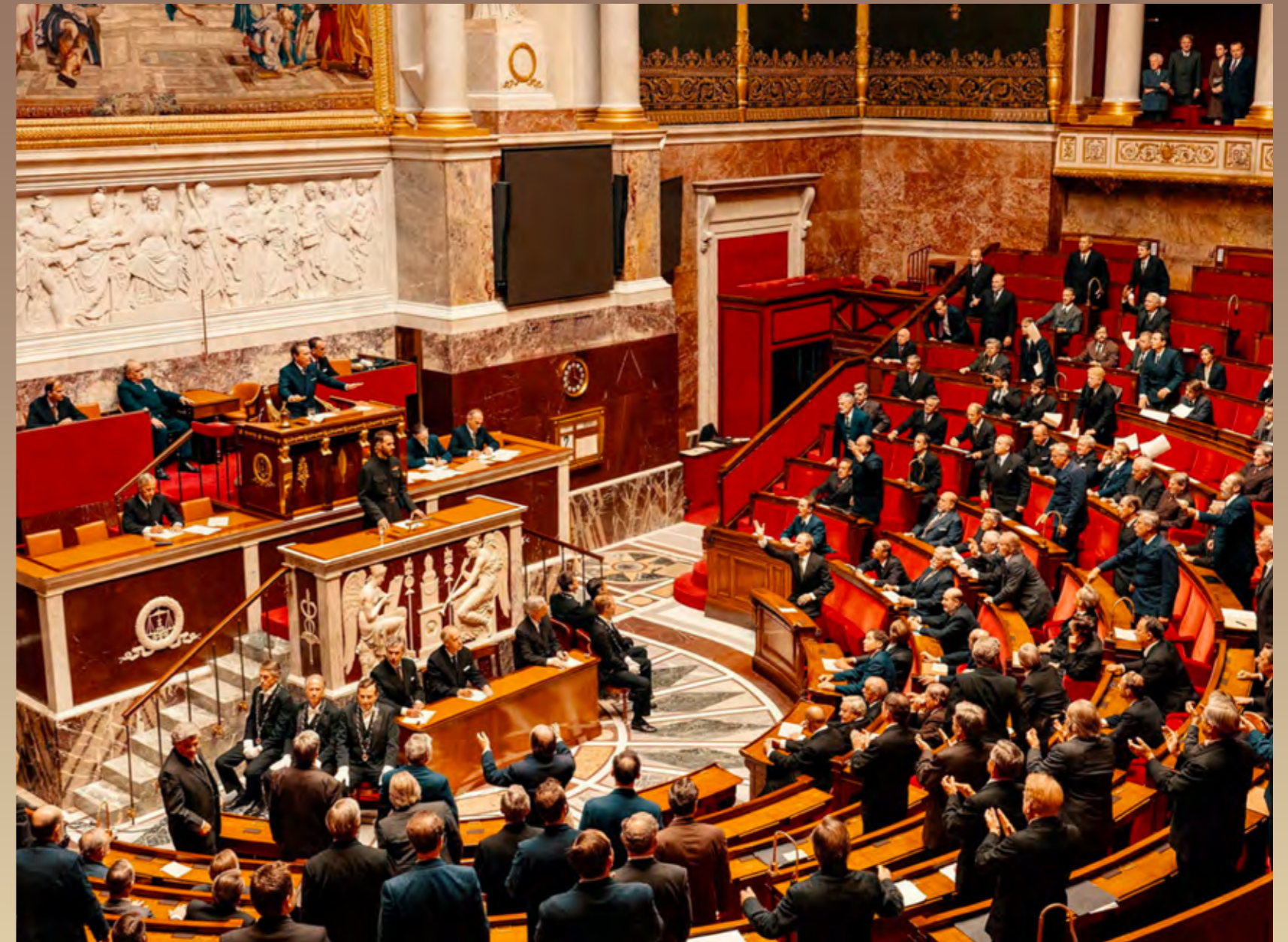
L'abbé Pierre à l'Assemblée Nationale, dans le film

L'intuition de l'abbé, à l'origine des compagnons d'Emmaüs, tient dans l'idée qu'aux désespérés il faut proposer du sens. Le secours peut consister à donner un toit ou des repas, mais il faut surtout leur donner les