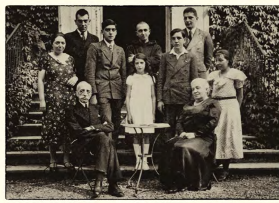
L'abbé Pierre en famille

Grouès entre au couvent des Capucins de Crest (Drôme), ordre des franciscains qui a fait vœu de pauvreté. Après avoir été « Castor méditatif » chez les scouts, Grouès devient « Frère La Joie ». Il est ordonné prêtre en 1938.