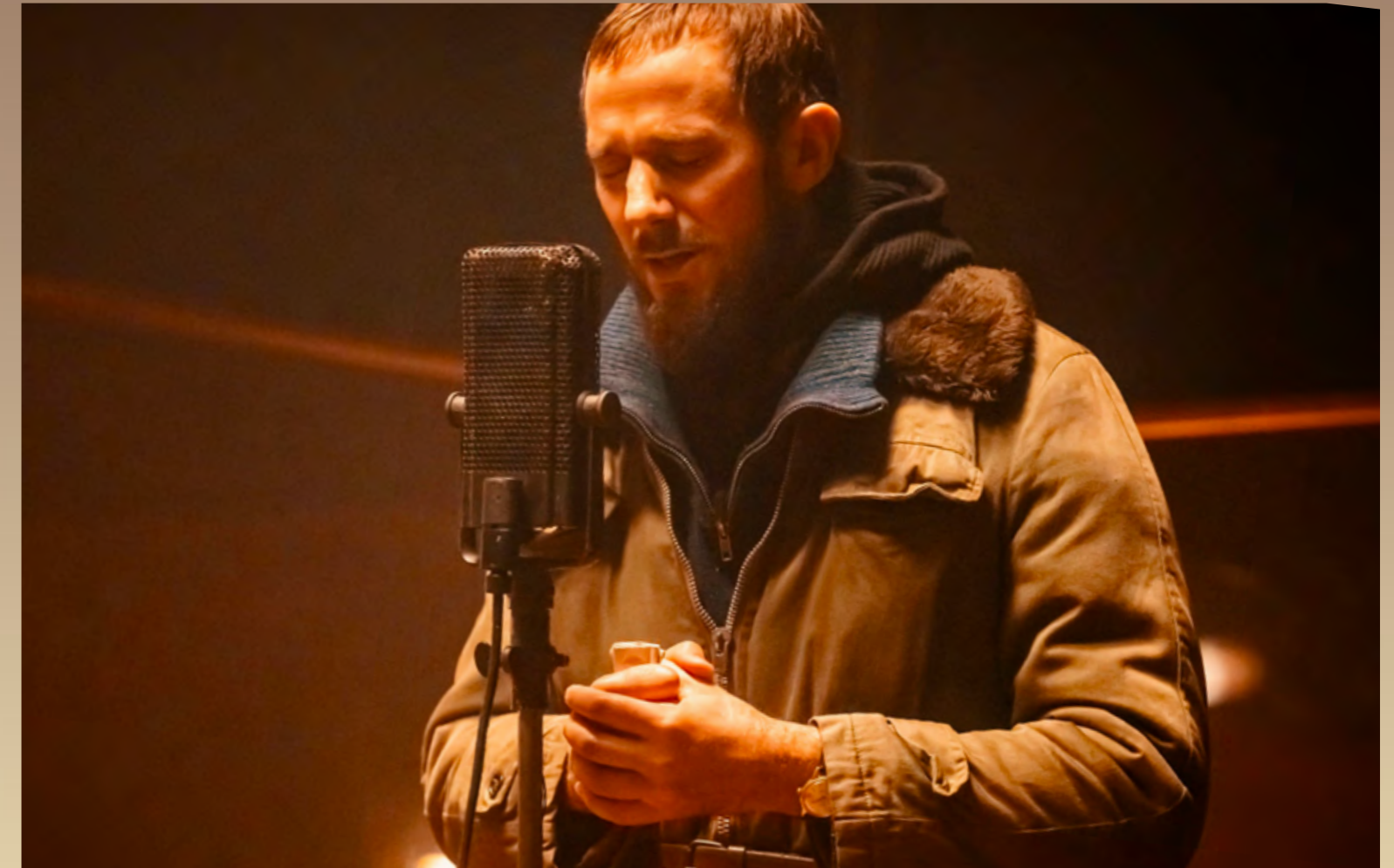
L'abbé Pierre lançant son appel au micro de RTL, dans le film