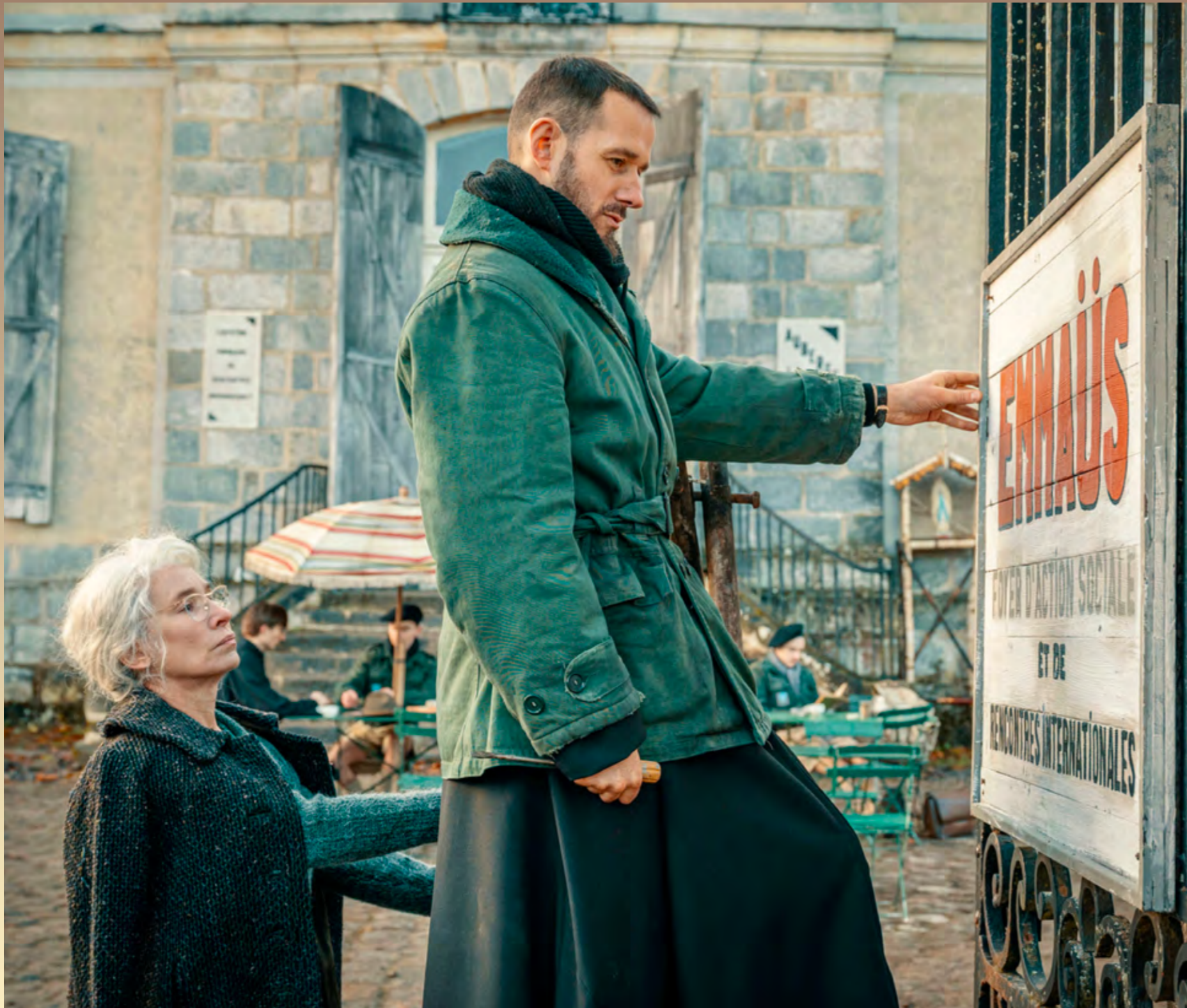
La fondation d'Emmaüs, dans le film