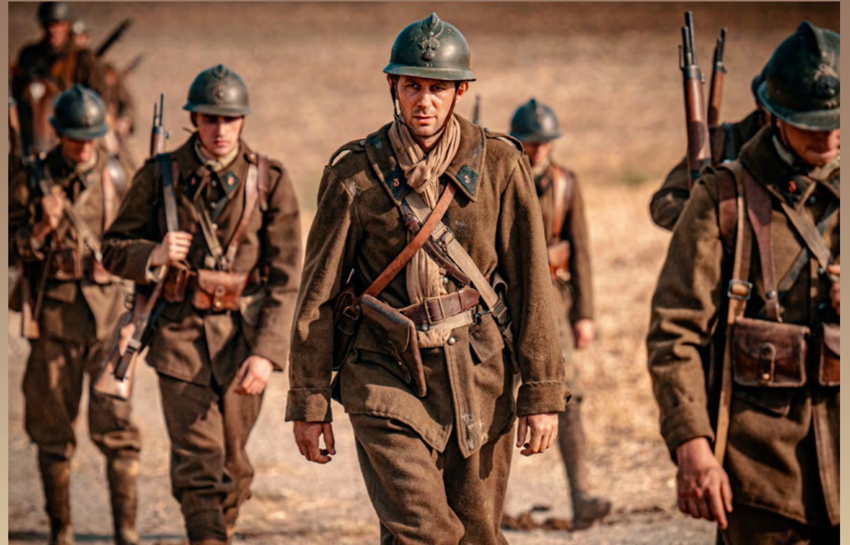
Henri Grouès soldat, dans le film

Dans ces conditions, rejoindre la résistance est pour un catholique, et plus encore pour un ecclésiastique comme l'abbé Pierre, un geste de désobéissance en même temps qu'une réelle remise en question des valeurs portées par l'institution. Ce geste est accompli par les démocrates chrétiens et les syndicalistes chrétiens qui se trouvent dans la France Libre dès 1940-41, le plus souvent par refus de la défaite, et dont une partie d'entre eux (Teitgen, Menthon...) fondent le journal Liberté . De plus, le mouvement de résistance spirituelle au nazisme déploie des efforts par le biais de publications et conférences clandestines pour prouver le caractère inhumain et anti-chrétien du nazisme et de la collaboration.