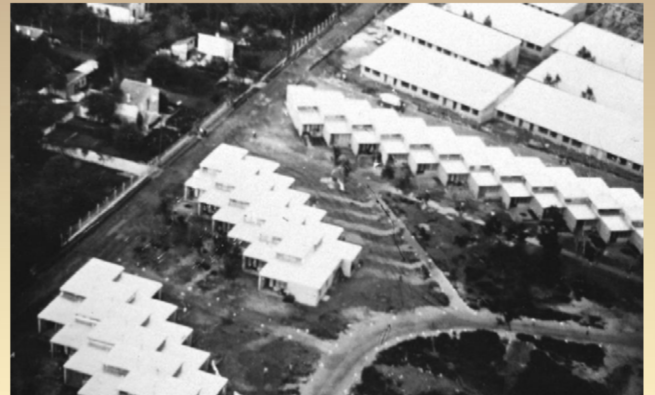
Les premières cités d'urgence