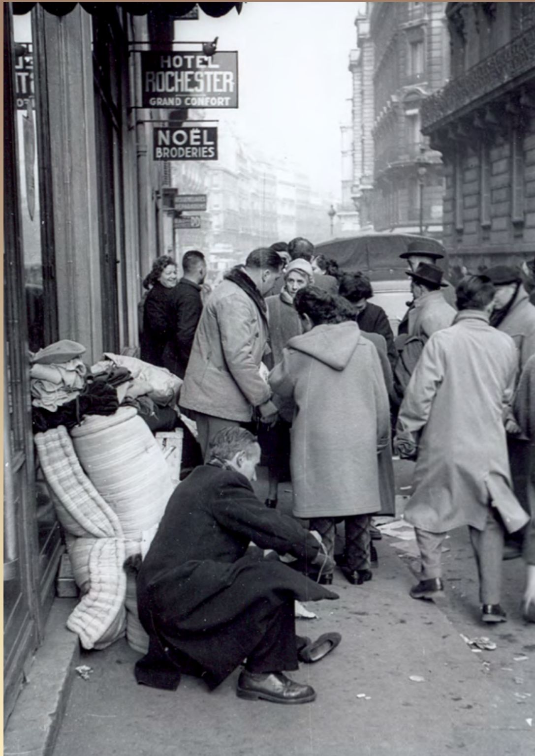
Devant l'hôtel Rochester, hiver 1954