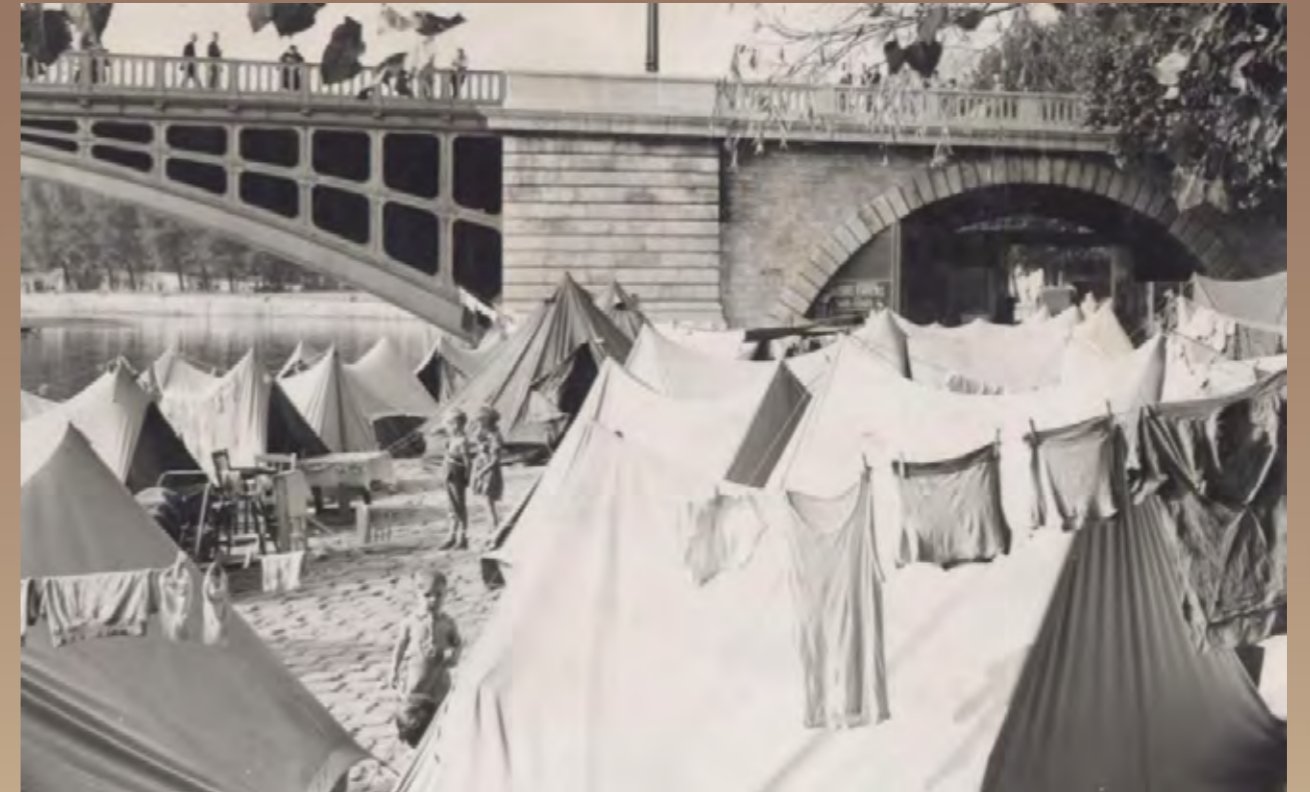
Les arches du Pont de Sully

Chaque année, près de 150 000 assignations pour expulsion sont prononcées, donnant lieu à une moitié de commandements à quitter les lieux, dont 15 000 à 16 000 sont réalisées avec l'intervention de la force publique. Le tiers des familles expulsées ne parviennent pas à retrouver de logement stable, vivant en hôtel, caravane, camping ou chez un tiers. (Source : lacroix.fr, lemonde.fr)