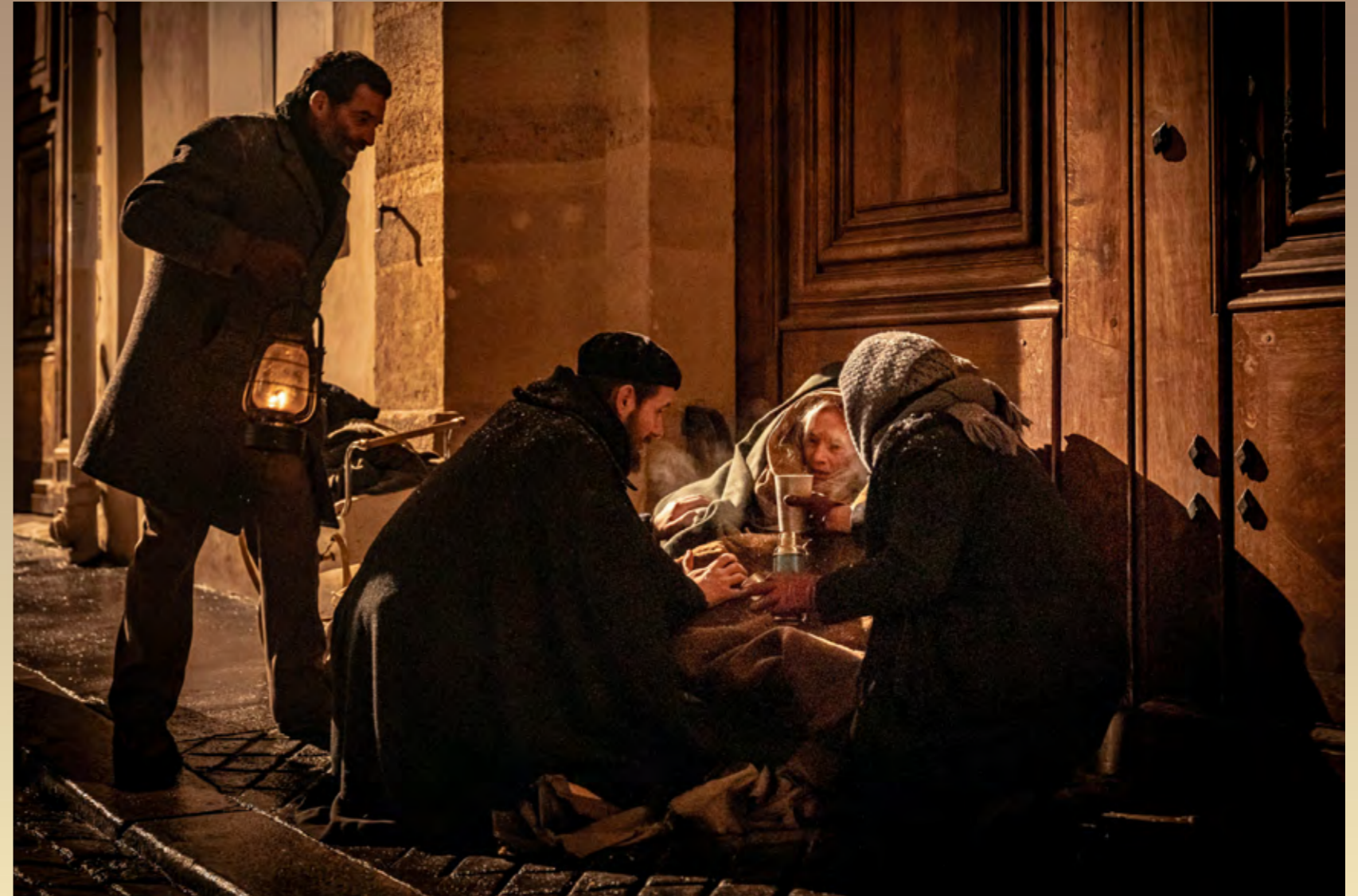
L'abbé Pierre pendant l'hiver 54, dans le film

Je crois qu'il a laissé quelque chose d'essentiel : respecter chacun pour ce qu'il est, laisser à chacune et chacun le droit de faire ses propres choix, d'avancer à son rythme. Il avait une immense foi en l'Homme. Pour lui, l'enjeu n'était pas d'aider en assistant (et en ce sens, il était en avance sur son temps) mais d'aider en permettant aux gens de grandir par eux-mêmes, de se reconstruire et de « se bouger » pour parvenir à le faire. Chacun a sa chance, chacun a sa place, chacun a une valeur.