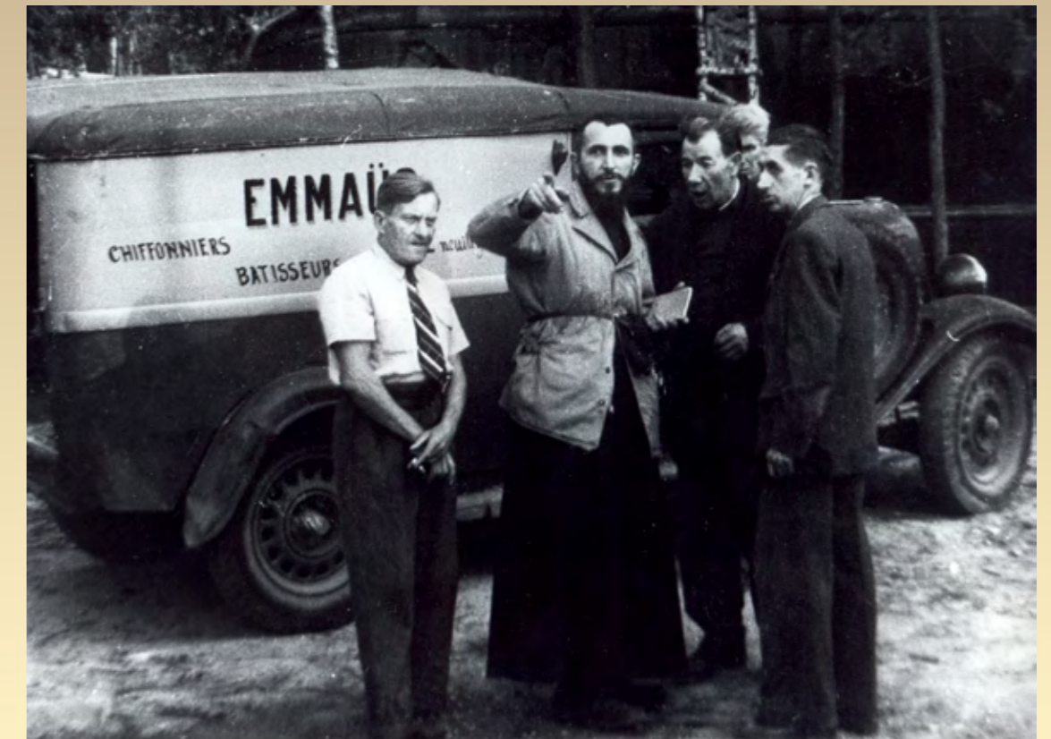
Neuilly-Plaisance, la première communauté d'Emmaüs