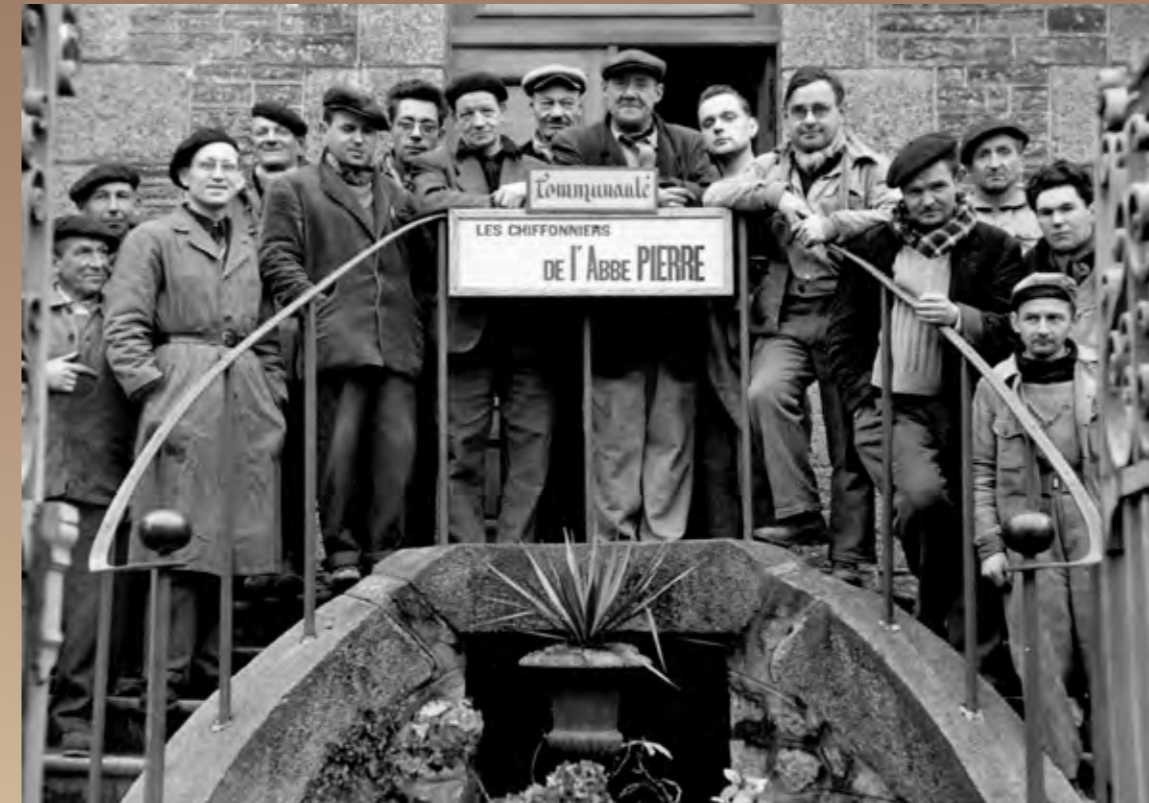
Les compagnons d'Emmaüs à Brest en 1957

TEXTE / Le rapport 2023 sur l'état du mal logement (les rapports précédents sont également disponibles) : https://www.fondation-abbe-pierre.fr/actualites/28e-rapport-sur-letat-du-mal-logement-en-france-2023