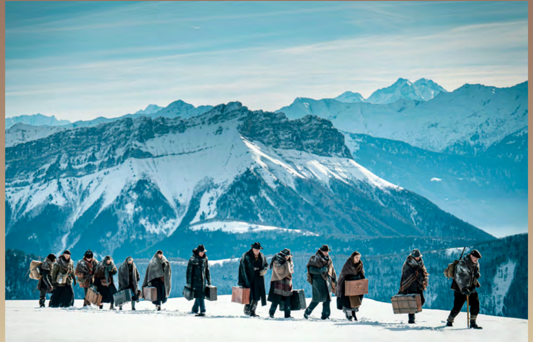
Le passage vers la Suisse, dans le film

Le drame des Glières de mars 1944 n'est que le début des opérations de répression de l'été 1944. Pourtant les maquisards ne baissent pas les bras et, avec les débarquements de Normandie et de Provence, les effectifs repartent à la hausse, jusqu'à atteindre 450,000 hommes, avec des meilleurs équipements parachutés par les alliés, et finalement davantage de succès stratégiques sous la supervision des Forces Françaises de l'Intérieur (FFI). Leur action permet de gêner la progression de la Wehrmacht et des SS.