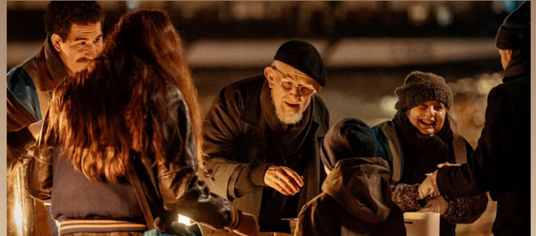
L'abbé Pierre participe à une distribution alimentaire d'Emmaüs, dans le film

Pour aller plus loin, on peut consulter les chiffres de la générosité en France à l'adresse https://www.francegenerosites.org/chiffres-cles/